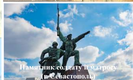
Памятник солдату и матросу (г. Севастополь)