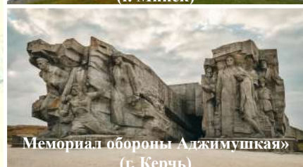
Мемориал обороны Аджимушкай (г. Керчь)