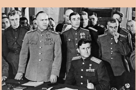
Гергий Жуков и Василий Сокловский на церемонии подписания Акта о безоговорочной капитуляции всех вооружённых сил Германии в Карлхосте.