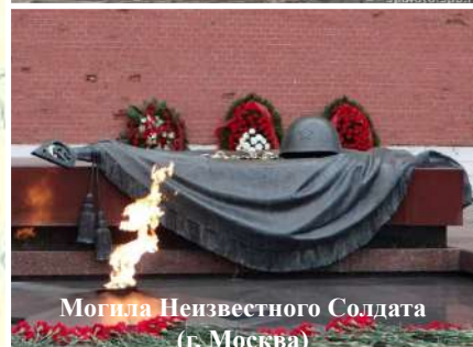
Могила Неизвестного Солдата (г. Москва)