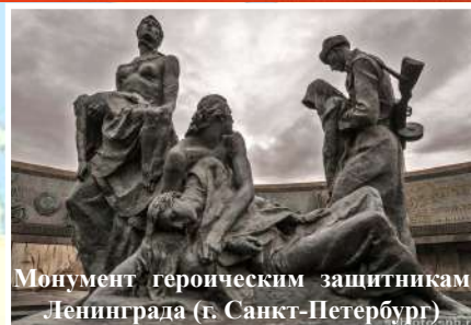
Монумент героическим защитникам Ленинграда (г. Санкт-Петербург)