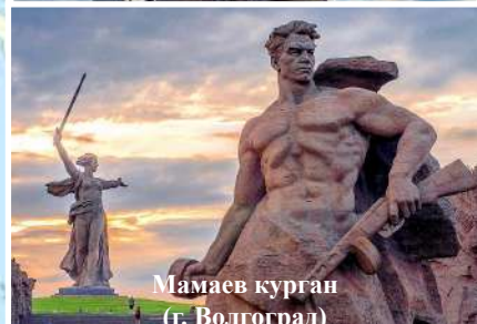
Мамаев курган (г. Волгоград)