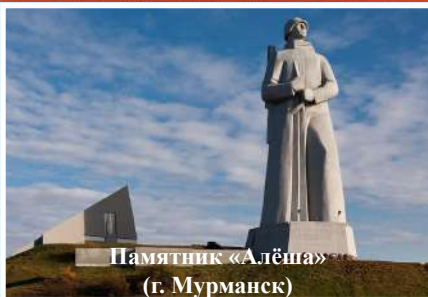
Памятник «Алёша» (г. Мурманск)