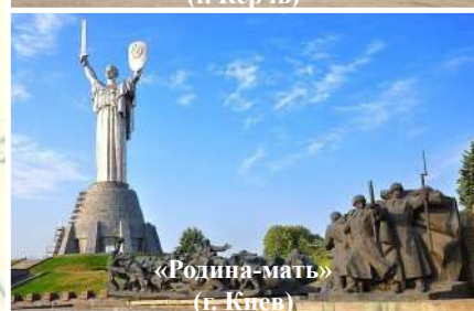
«Родина-мать» (г. Киев)