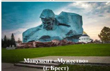
Монумент «Мужество» (г. Брест)